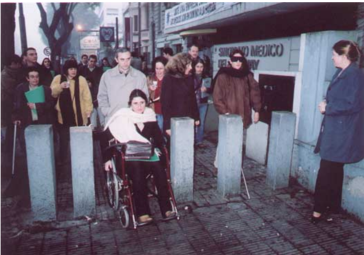
PONETE EN MI LUGAR Durante la jornada se realizaron actividades demostrativas de los efectos de muchos de los impedimentos urbanísticos y arquitectónicos.

tando estar muy complacida por el grupo de trabajo que se estaba creando y formalizando (que es la ampliación y oficialización del grupo conformado por médicos y arquitectos para la puesta en práctica de esta Jornada) y poniendo finalmente a disposición el ámbito creado en el Programa "Todos por Uruguay" para impulsar y estimular desde allí la concreción de los objetivos trazados por este grupo de trabajo.