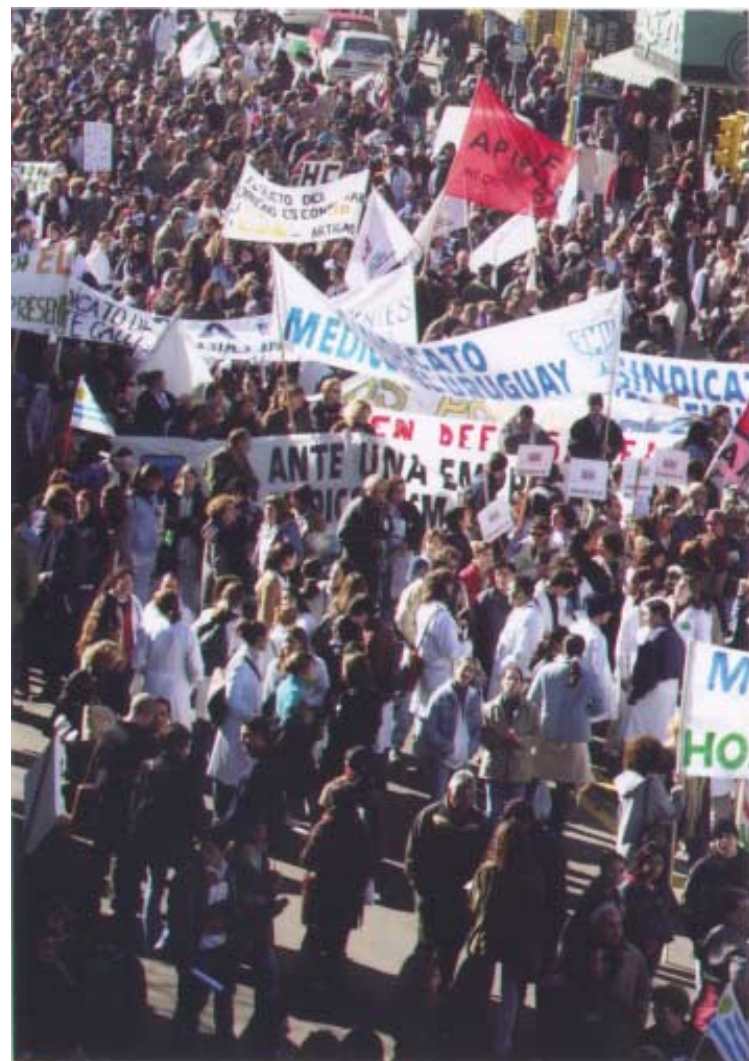
MANIFESTACIÓN La movilización de miles de uruguayos permitió encontrar paliativos para la grave crisis del Hospital.