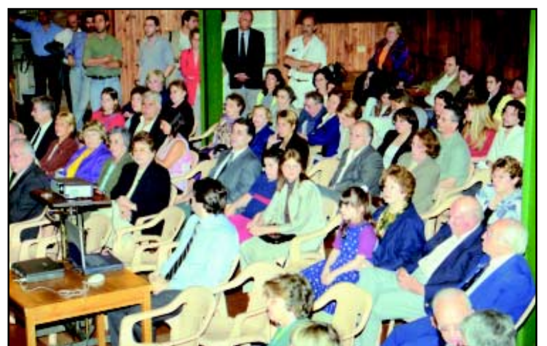
Vista parcial del público asistente.