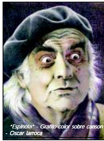
"Espínola" - Grafito color sobre canvas - Oscar Larroca

Para recordarlo recurrimos a la obra de otro destacado artista plástico nacional Oscar Larroca.