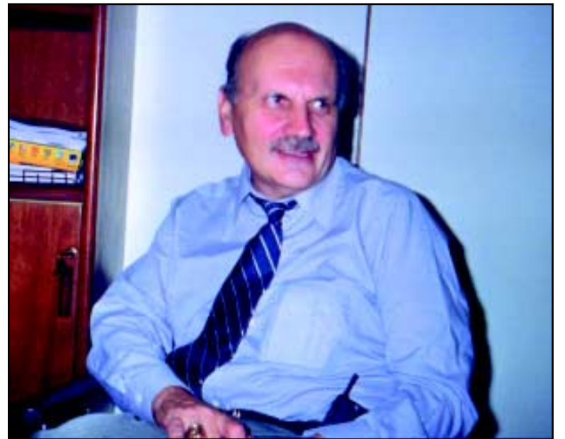
Dr. Homero Bagnulo

El próximo 7 y 8 de agosto, se realizará en el Hotel NH Columbia la segunda edición de EUROSUR: Encuentro en Control de Infecciones.