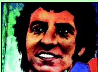
Victor Jara "en cinco minutos la vida es eterna"