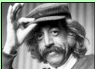
Eduardo Mateo Un músico del tiempo