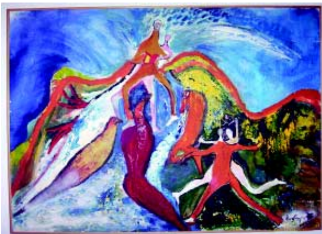
"Desarrollo 1" Gustavo Figueroa