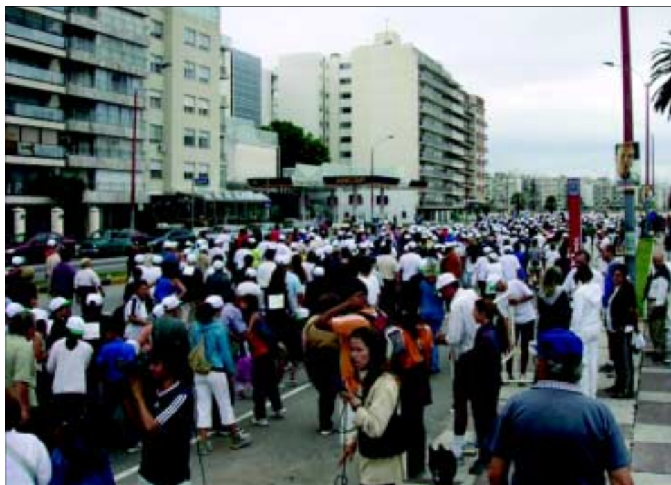
Aspectos de la concurrencia previo a la largada.