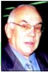
PROF. ELBIO D. ÁLVAREZ

Presentimos que escribiremos hoy desde el corazón. Con los más puros de nuestros sentimientos. Con las más hondas de nuestras sensibilidades. Bajo el dictado de los valores que vienen desde la humildad de nuestros orígenes. Con el más profundo de nuestros compromisos con nuestros semejantes y más aún con aquellos de los nuestros que son más sensibles a las injusticias por sufrirlas o haberlas sufrido y, por ello, con mayores fortalezas para enfrentar los embates y temporales de un Uruguay en crisis y también más propensos a construir el entretejido de las esperanzas