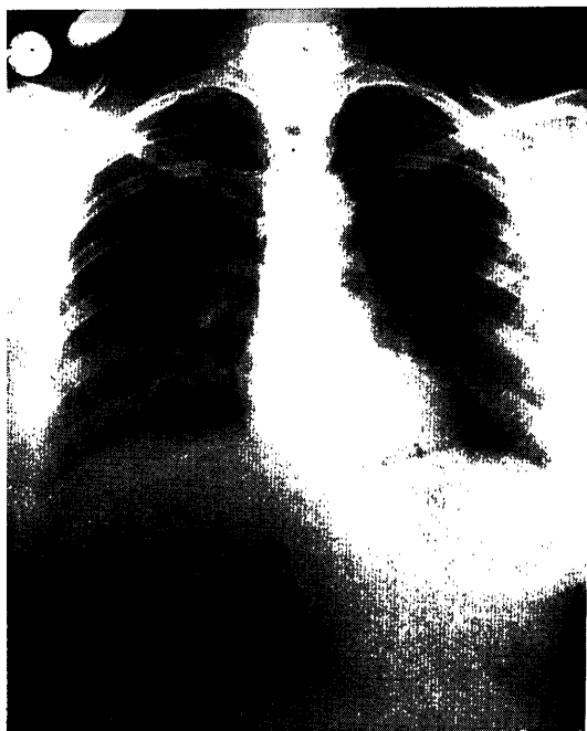
FIGURA 32. Lesiones de tuberculosis miliar. Regresión total.