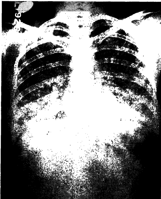
FIGURA 30. Lesiones de tuberculosis miliar. Lesión inicial.

Respecto a la evolución pronóstico y tratamiento de estos procesos tuberculosos hay que separar tres etapas que se han sucedido con los progresos terapéuticos: antes de la insulina; con el descubrimiento de la insulina; con la incorporación de las nuevas medicaciones antibacilares.