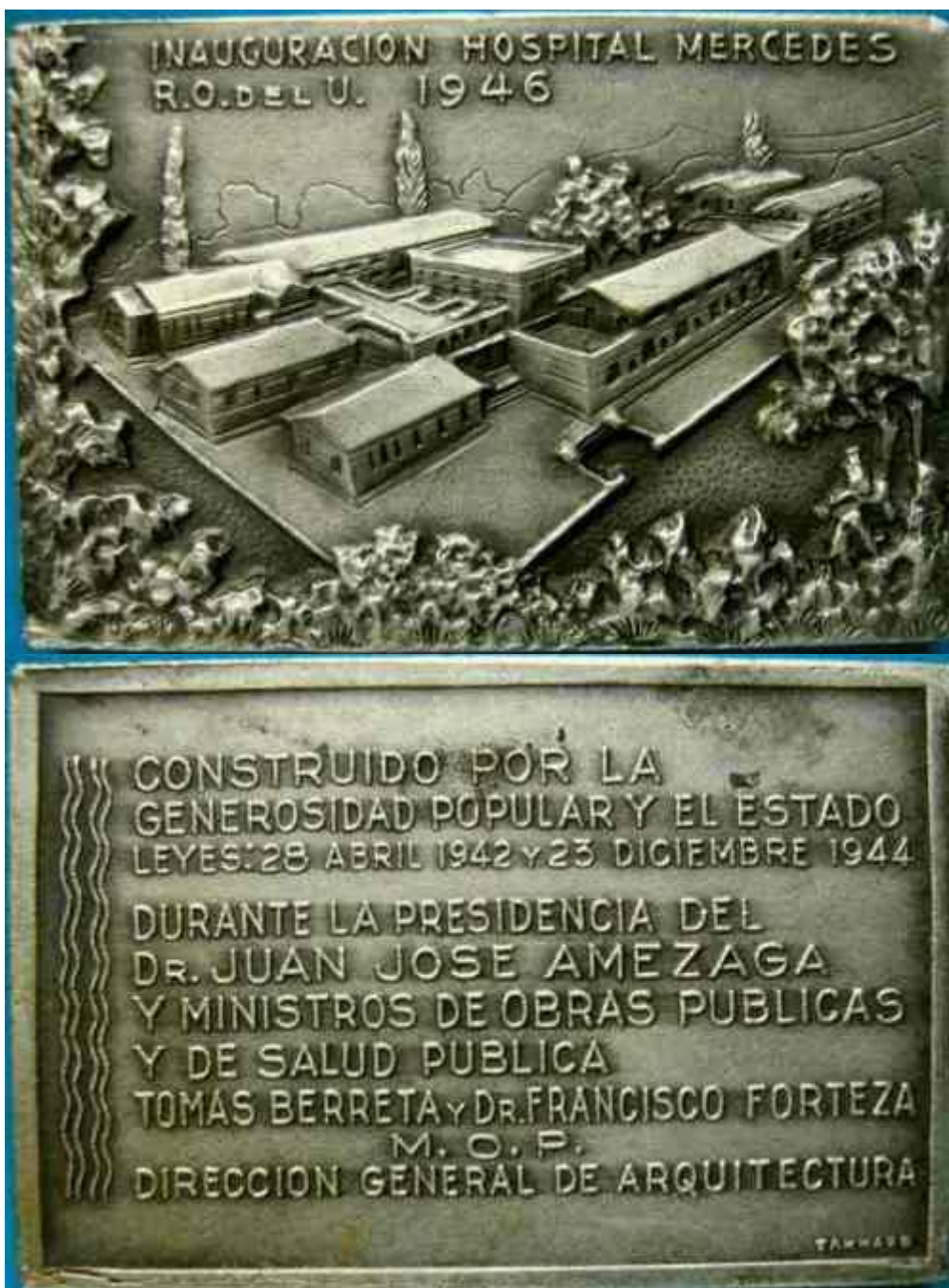
Medalla recordatoria de la inauguración en 1946 del edificio del Hospital Departamental de Soriano, en Mercedes.