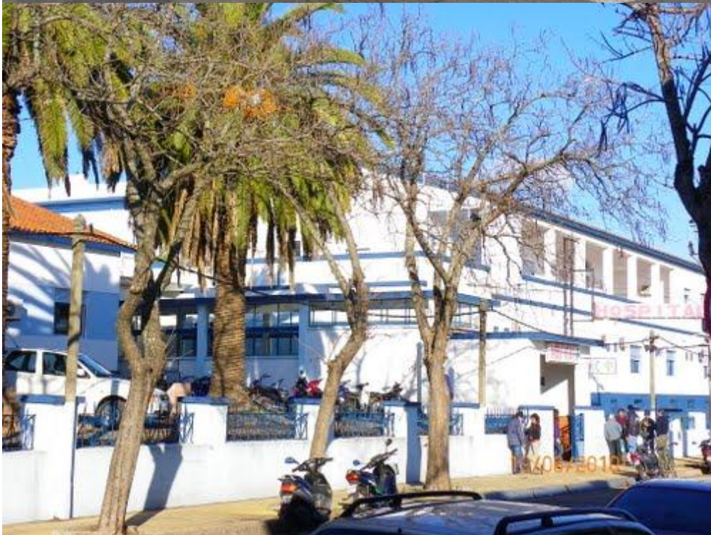
El Hospital "Dr. Zoilo Chelle", de Mercedes, Soriano.