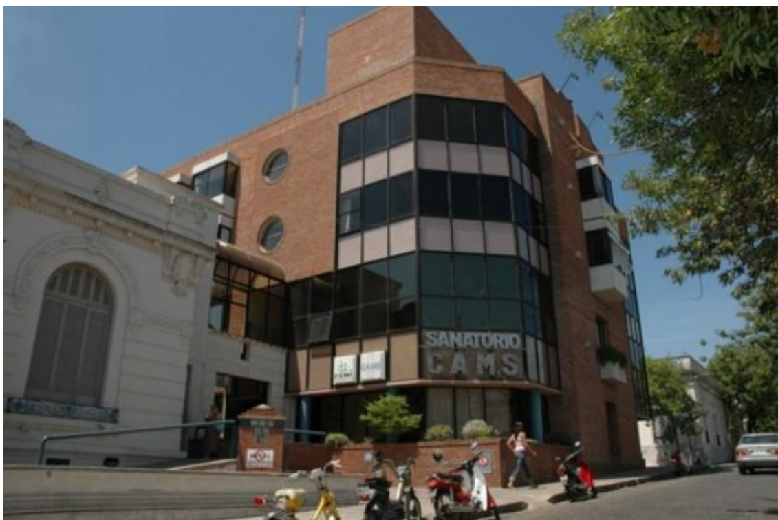
Sanatorio renovado de CAMS, en Mercedes.