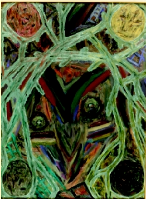
III. Premio Colonia de Vacaciones «Las máscaras del profano» Dr. Escandor El Ters