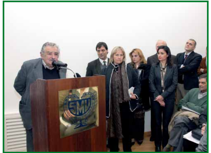
El presidente de la República, Sr. José Mujica en momentos en que se dirige a los asistentes