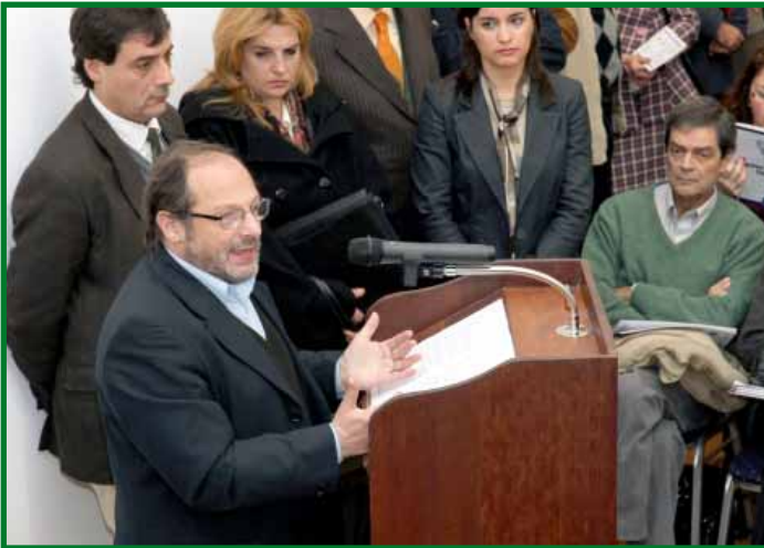
El ministro de Salud Pública, Ec. Daniel Olesker, haciendo uso de la palabra